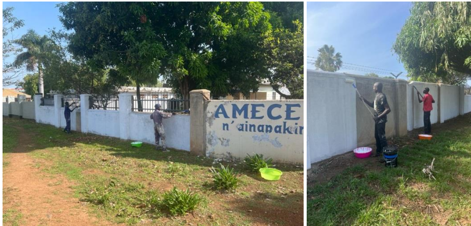
Amecet wordt opgeknapt en kan er weer duurzaam tegenaan..!

weer toekomstbestendig. Een deel van dit werk wordt betaald door de opbrengst van het benefiet concert ter ere van het 21-jarige Amecet in de Mythe te Goes afgelopen december.